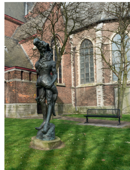
© Toerisme Scheldeland - Mie De Backer