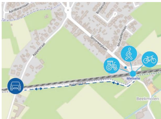
Nieuwe situatie vanaf 28/08

Alle inwoners van Melsele ontvangen deze week een bewonersbrief over de werken van Infrabel in de brievenbus.