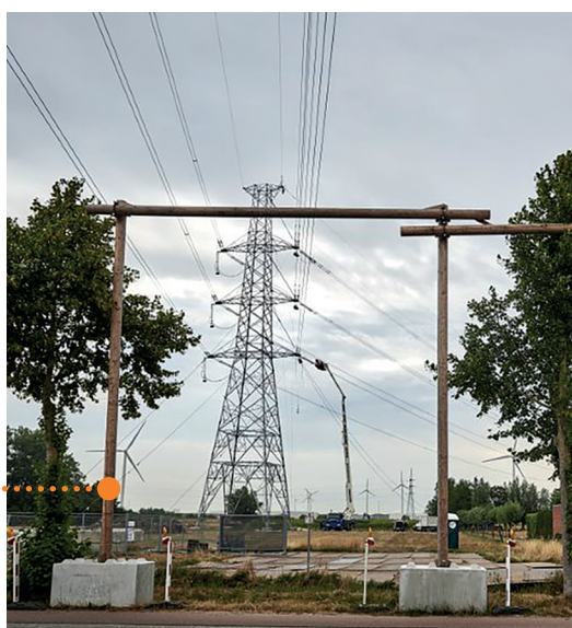
Installatie van twee houten portieken onder een luchtlijn.

Elia is verantwoordelijk voor het beheer, het onderhoud en de uitbouw van het Belgische hoogspanningsnet. Tijdens werkzaamheden aan de bovengrondse luchtlijnen plaatst Elia, indien nodig, beschermportieken onder de elektriciteitsdraden. De beschermportieken bestaan uit minstens twee met elkaar verbonden palen die obstakels onder de luchtlijn beschermen.