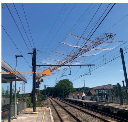
Een kraan met beschermnet beschermt de spoorlijnen.

Portieken bestaan uit minstens twee houten palen die in volle grond of, indien nodig, in betonvoeten worden geplaatst. De houten palen zijn met elkaar verbonden met een balk. Afhankelijk van de breedte van de luchtlijn worden één of meerdere portieken langs elkaar geïnstalleerd.